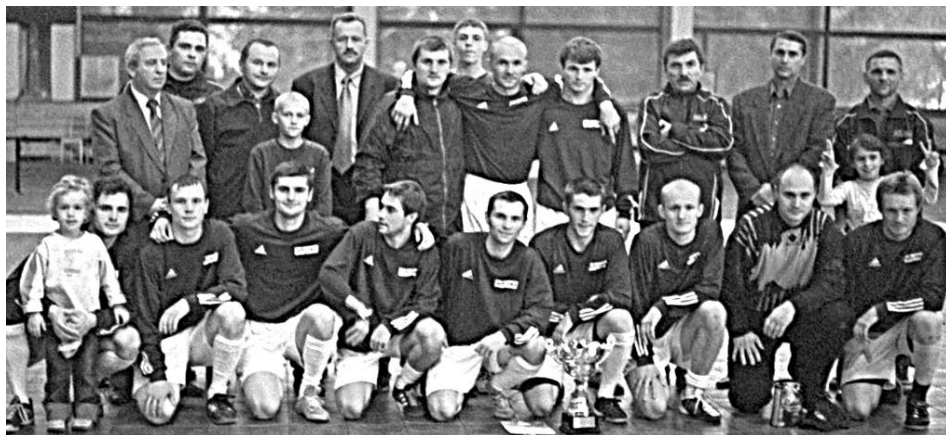
Команда МАПИД (Минск) – первый обладатель Суперкубка Беларуси