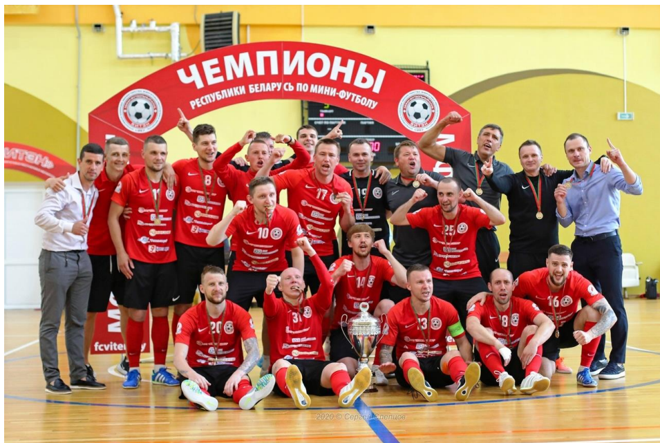
«Витэн» (Орша) – чемпион Беларуси 2020 г.